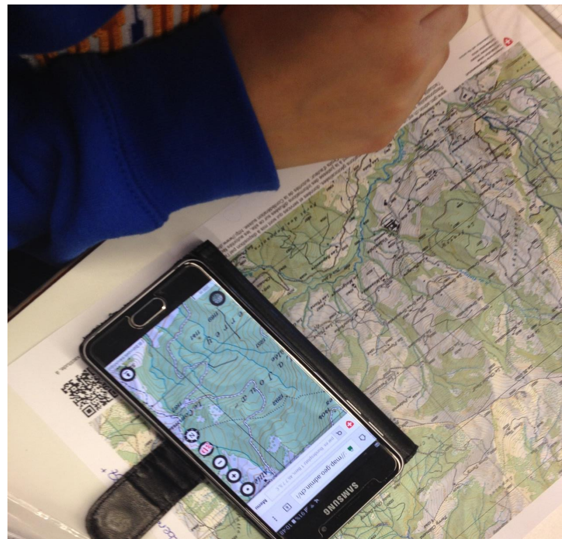
9 mars 2017

Ici, illustration d'une évaluation concernant le tracé de bassins-versants en utilisant le code QR de swisstopo (changement d'échelles sur l'écran)